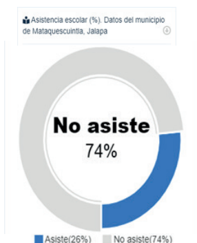
Figura 1. Asistencia escolar, Mataquesuintla, Jalapa

En la actualidad, la cobertura educativa es el 26% en el nivel básico. La modalidad Telesecundaria tiene cobertura en once aldeas del municipio: Aldea Joya del Mora, Caserío La Brea (Aldea Las Flores), Aldea Los Magueyes, Aldea La Esperanza, Caserío El Pajalito (Aldea El Pajal), Aldea Pino Dulce, Aldea San Miguel, Aldea Morales, Aldea Sansupo, Aldea Sampaquisoy, Aldea Samororo. De los anteriores, destacan dos Telesecundarias Aldea Joya del Mora y Telesecundaria Pino Dulce, cuyos directores atienden aulas multigrados por ser el único docente al frente de la institución.